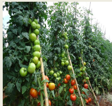
Figura1: Cultivo de tomate de variedade melhorada.

Segundo Instituto de Investigação Agrária de Moçambique-IIAM, as variedades melhoradas de tomate (HTX, KIARA, NAGAIA)